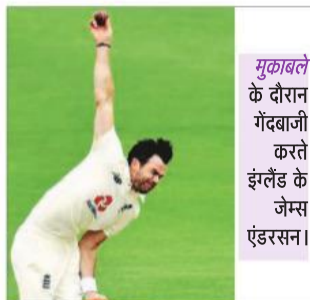
मुकाबले के दौरान गेंदबाजी करते इंग्लैंड के जेम्स एंडरसन।

रिजवान 116 गेंदों में पांच चौकों की मदद से 60 रन बनाकर एक छोर संभाले हुए हैं जबकि नसीम शाह एक रन बनाकर खेल रहे हैं। खराब रोशनी के कारण चाय व लंच ब्रेक पहले लेना पड़ा। इंग्लैंड के लिए जिम्मी एंडरसन और