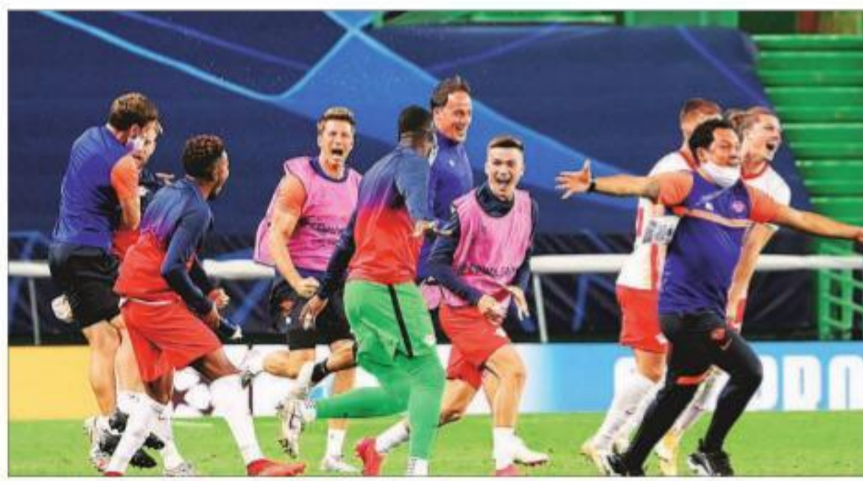
जीत के बाद खुशी मनाते लेपजिग के खिलाड़ी व स्टाफ।

लीपजिग के लिए दानी ओल्मो ने 51वें मिनट में गोल कर बहुत दिलाई। लेकिन 71वें मिनट में एटलेटिको ने जाओ फेलिक्स के गोल की मदद से इसे बराबर कर लिया।